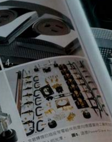
▲圖2-3. 全數精確的點焊等組件均經向德國當地工業級廠家採購，並委託德國當地的精確光，方有如此光可鑑人的光澤。

得，如沐春風之感，這些都是優質電源排插基本該有的特質。至於音色彩度鮮豔，明暗階調細膩，線條滑潤順暢，高音延時格外華麗，低音聲部飽滿紮實，彈性十足，又能保有優雅紳士的豐厚氣質，這些則是PowerSlave Acrylic在面對各聲部樂句音色處理上的獨到之處。