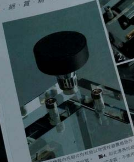
▲圖1. 排插殼內各組件均有以物理性超精細加工，機械精度遠加英國威利Soundcar+駱維興音響廠，僅此一家，別無分號。